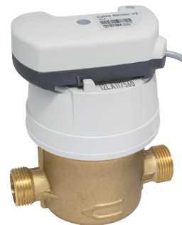
Compteur eau équipé d'un module cyble sensor