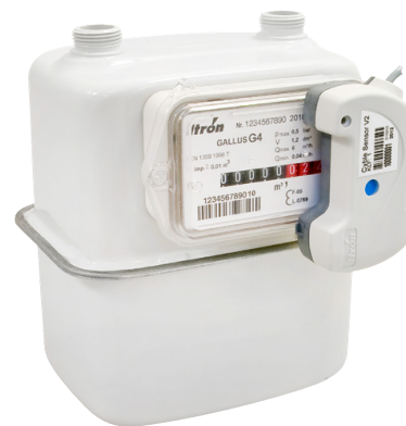
Compteur gaz équipé d'un module cyble sensor