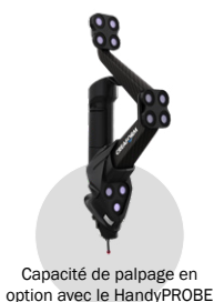
Capacité de palpation en option avec le HandyPROBE